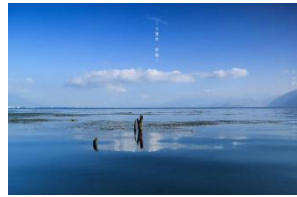
云南洱海双廊镇客栈