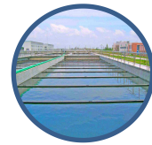
其它水处理相关需求行业