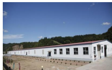
新疆奇台县屠宰项目