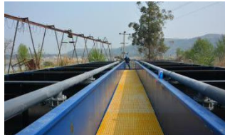
绵阳乡镇污水处理