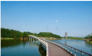
成都夏纳湾污水处理