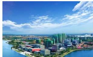
成都黑臭河道治理